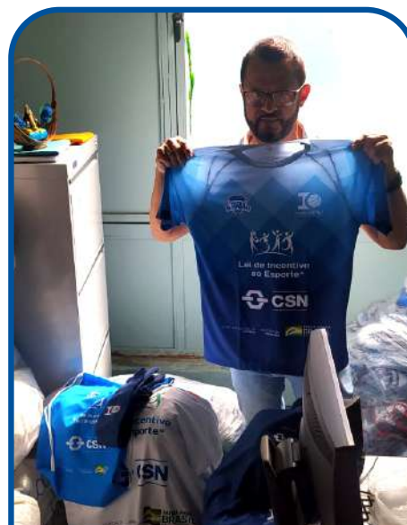
Uniformes do projeto: camiseta, meião e short