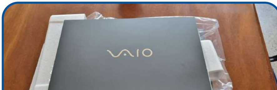
Material de informática: notebook