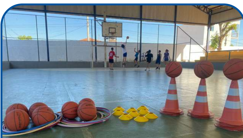
Materiais para as aulas: cones, bambolês, bolas de basquete e discos (modelo plástico)