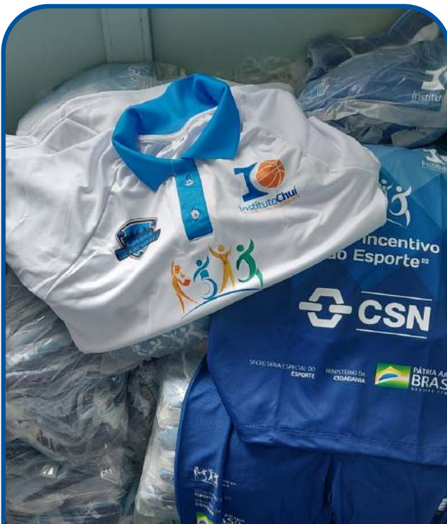
Uniformes do projeto: camiseta gola polo, camiseta e short.