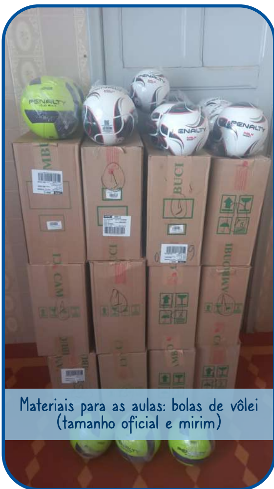
Materiais para as aulas: bolas de vôlei (tamanho oficial e mirim)