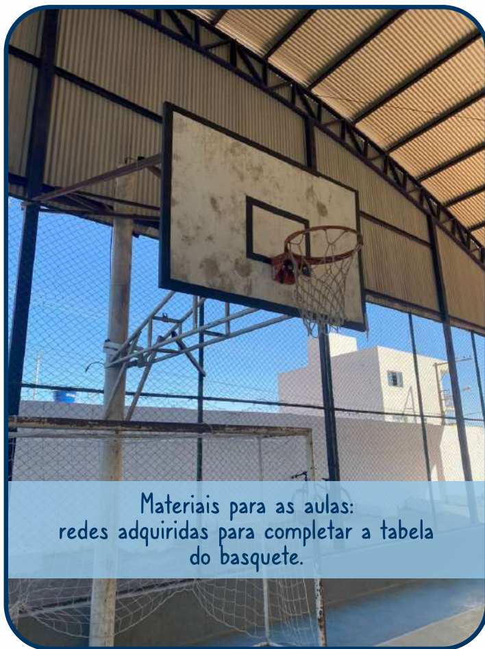
Materiais para as aulas: redes adquiridas para completar a tabela do basquete.