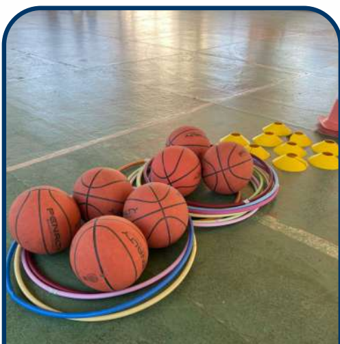
Materiais para as aulas: bambolês, bolas de basquete e discos (modelo plástico)