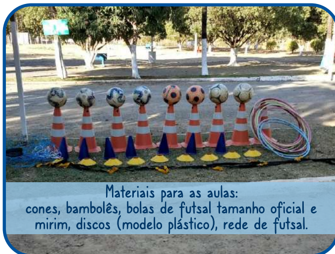
Materiais para as aulas: cones, bambolês, bolas de futsal tamanho oficial e mirim, discos (modelo plástico), rede de futsal.