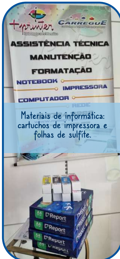
Materiais de informática: cartuchos de impressora e folhas de sulfite.