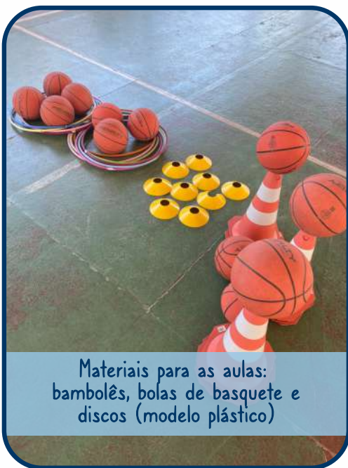
Materiais para as aulas: bambolês, bolas de basquete e discos (modelo plástico)