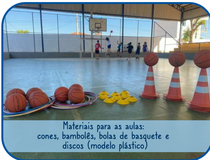
Materiais para as aulas: cones, bambolês, bolas de basquete e discos (modelo plástico)